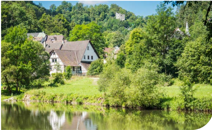
Idylle pur: der Neckar bei Talhausen.

Die Radtour führt auf gut 30 Kilometern von Rottweil aus ins Neckartal und ins Albvorland. Sie verbindet bei überschaubaren Höhenmetern Natur- und Kulturerlebnisse. Gleich mehrere imposante Burgruinen säumen den Weg: die Neckarburg nahe Rottweil, die Burgruine Herrenzimmern oberhalb von Talhausen sowie die Burgruine Irslingen im Schlichemtal bei Epfendorf. Hier führt die Tour vom Neckar hinauf auf die Höhe; es bieten sich wunderbare Ausblicke zur Schwäbischen Alb. Über Dietingen geht es zurück nach Rottweil. Hier lädt die historische Innenstadt zum Spaziergang ein. Noch mehr Fernsicht ermöglicht ein Besuch auf der Aussichtsplattform des tk-elevator-Testturms; ein bisschen Nervenkitzel verspricht – ab Ende April – der Gang über die neue Hängebrücke.