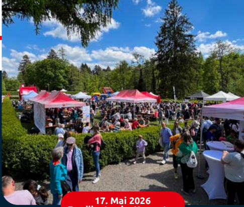
17. Mai 2026 Familientag im Kurgarten