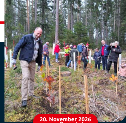
20. November 2026 Baumpflanzaktion