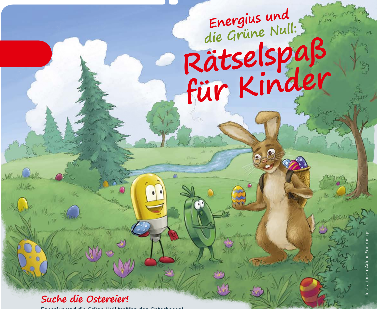
Illustrationen: Adrian Sommerberger