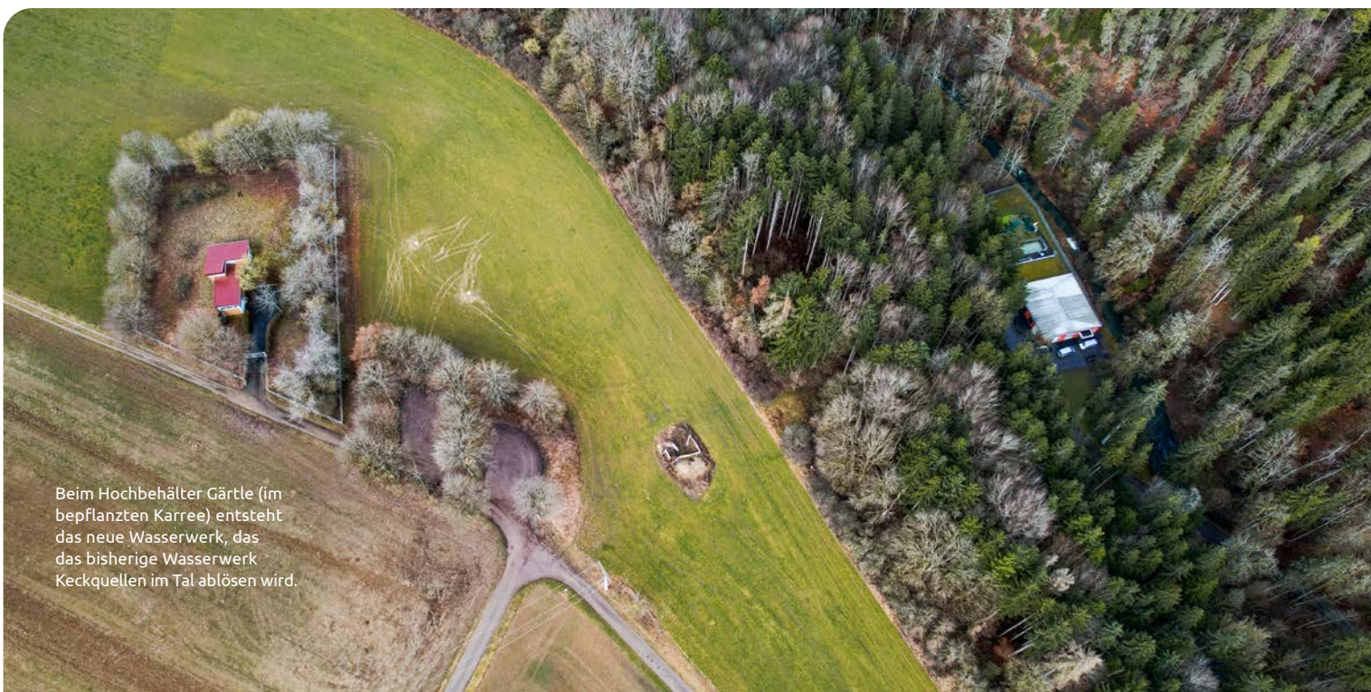
Beim Hochbehälter Gärtle (im bepflanzen Karree) entsteht das neue Wasserwerk, das das bisherige Wasserwerk Keckquellen im Tal ablösen wird.

Mitte Mai soll der Spatenstich des neuen Wasserwerks in der Nähe der Keckquelle und des Hochbehälters Gärtle erfolgen. Die Fertigstellung ist für das Jahr 2029 geplant. Das Wasserwerk ist die große Schwester eines Wasserwerks im Gebiet Aulfingen bei Geisingen. Dieses gilt als Vorbild für den ZVK-Neubau und signalisiert die regionale Verbundenheit. Die Investition wird auf elf Millionen Euro beziffert, wovon das Land knapp 1,5 Millionen Euro fördert.